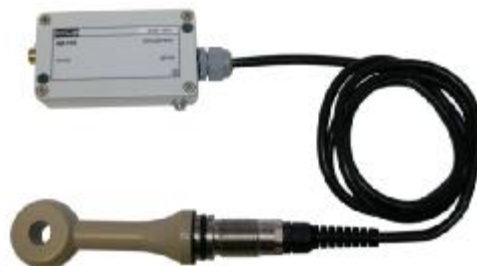
б – БД-1102