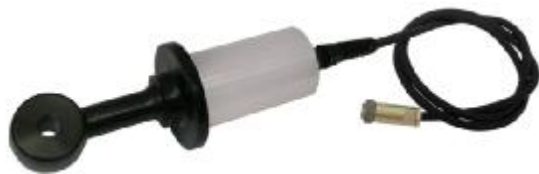
а – БД-1102/1