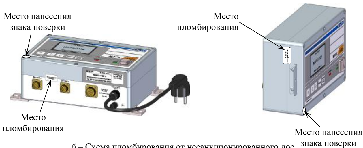
б – Схема пломбирования от несанкционированного доступа к элементам конструкции (наклейка изготовителя), обозначение места нанесения знака поверки