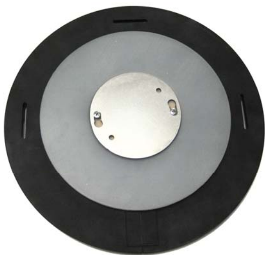
Гибкий диск 003РД в сборе

Конструктивно 003РД представляет собой резиновый диск с прорезью под кабель, в середину которого встроена металлическая чашка для установки вибродатчика. Над чашкой расположена резиновая прокладка (для установки датчика АР2038Р) и крышка чашки. К диску прилагается специальный ключ для снятия крышки чашки, дополнительная пара установочных шурупов (см рисунок), а также монтажная мастика для дополнительной фиксации датчика в камере.