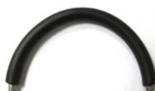
Ключ к диску