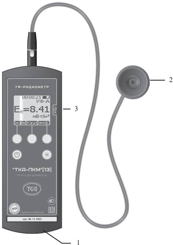
Рис.1 – Внешний вид прибора “TKA-ПКМ”(13)