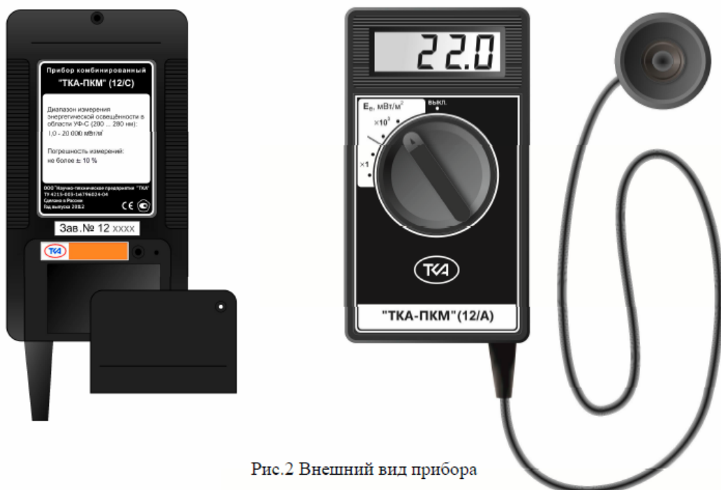
Рис.2 Внешний вид прибора