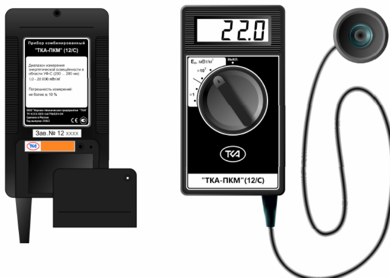
Рис.2 Внешний вид прибора