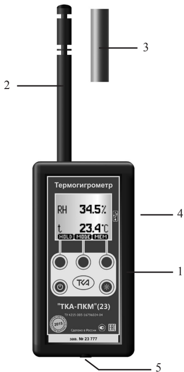
Рис.1. Внешний вид прибора “ТКА-ПКМ”(23)