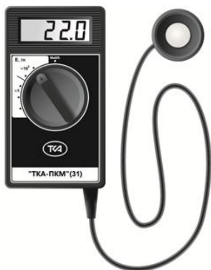
Рисунок 1 - Вариант исполнения 1