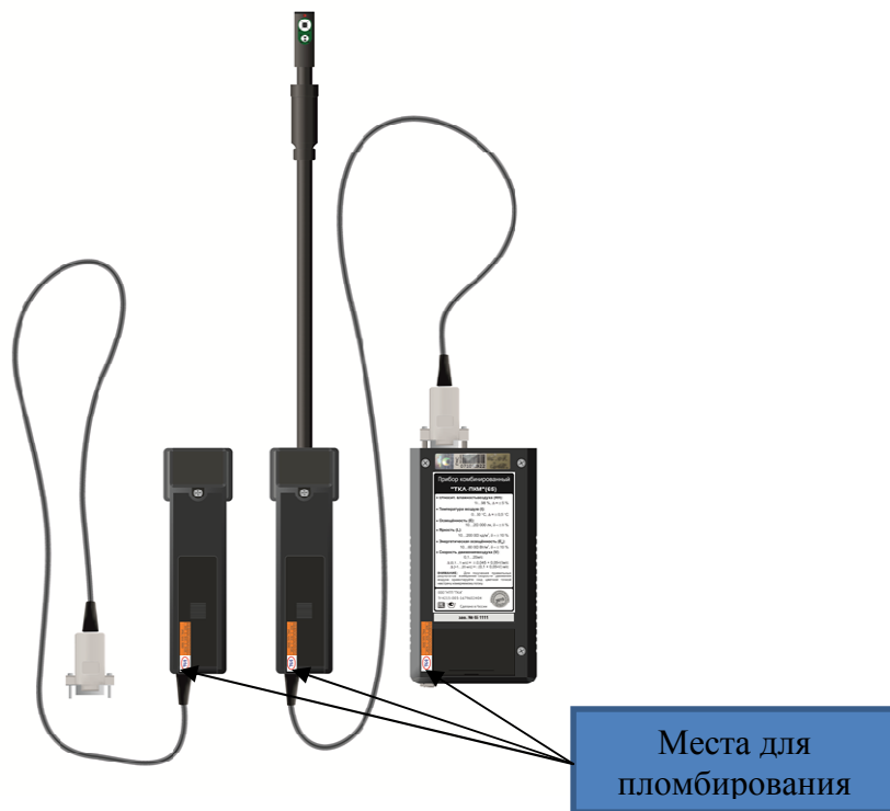
Рисунок 5 - Приборы комбинированные «ТКА-ПКМ» (на примере варианта исполнения 3), вид сзади