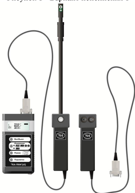
Рисунок 3 - Вариант исполнения 3