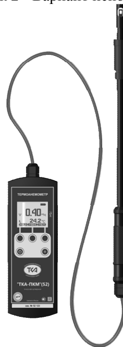
Рисунок 4 - Вариант исполнения 4