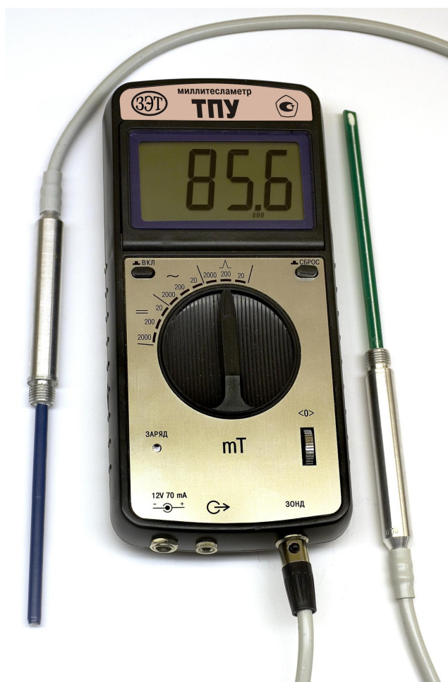
Рис.1. Внешний вид миллитесламетра портативного универсального ТПУ

вателя Холла, обработки информационных сигналов преобразователя и представления результатов измерения в цифровом виде на жидкокристаллическом цифровом табло.