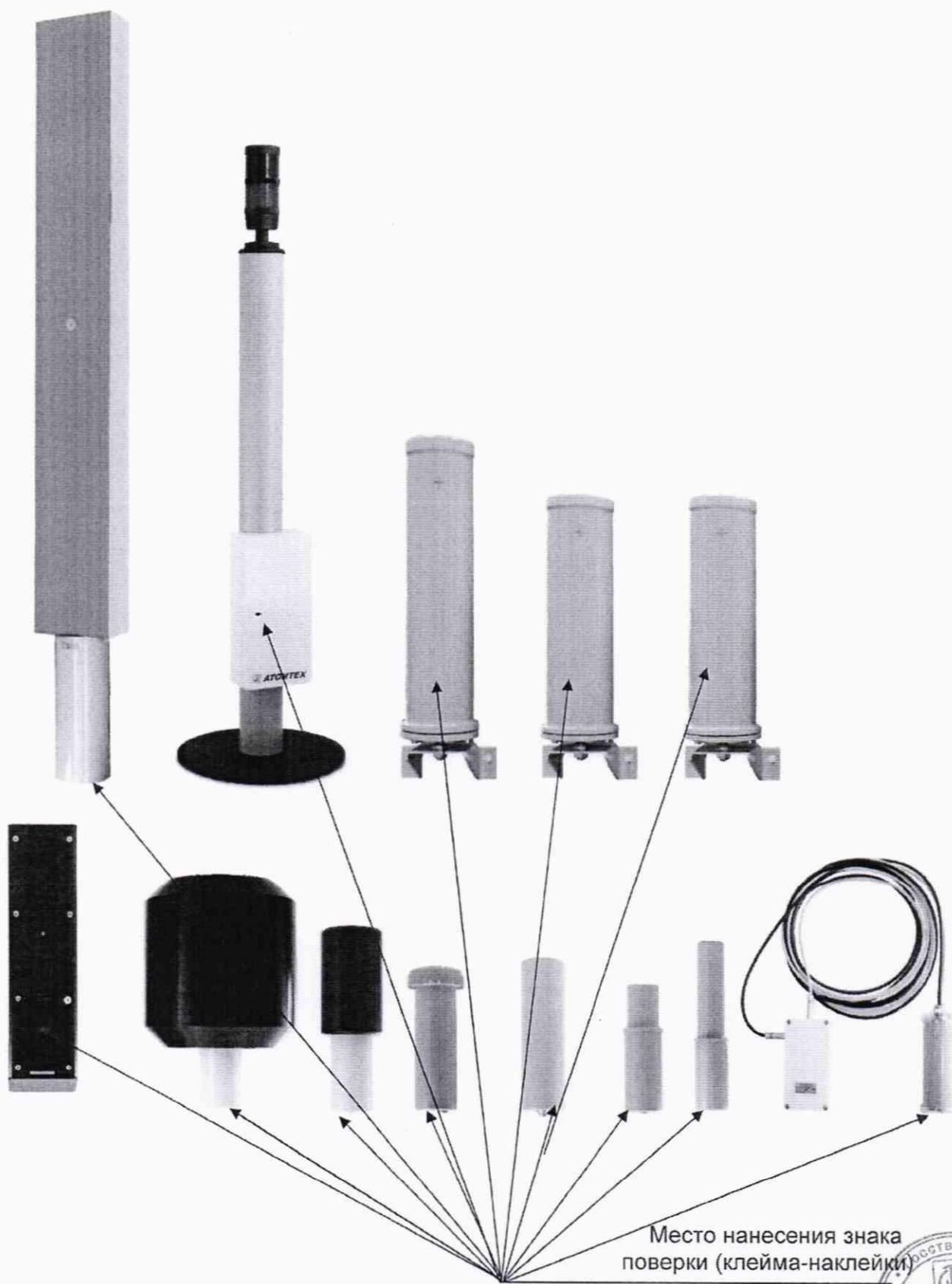
Рисунок 2 – Схема с указанием места нанесения знака поверки (клейма-наклейки)

Схема с указанием места нанесения знака поверки (клейма-наклейки) приведена на рисунке 2.