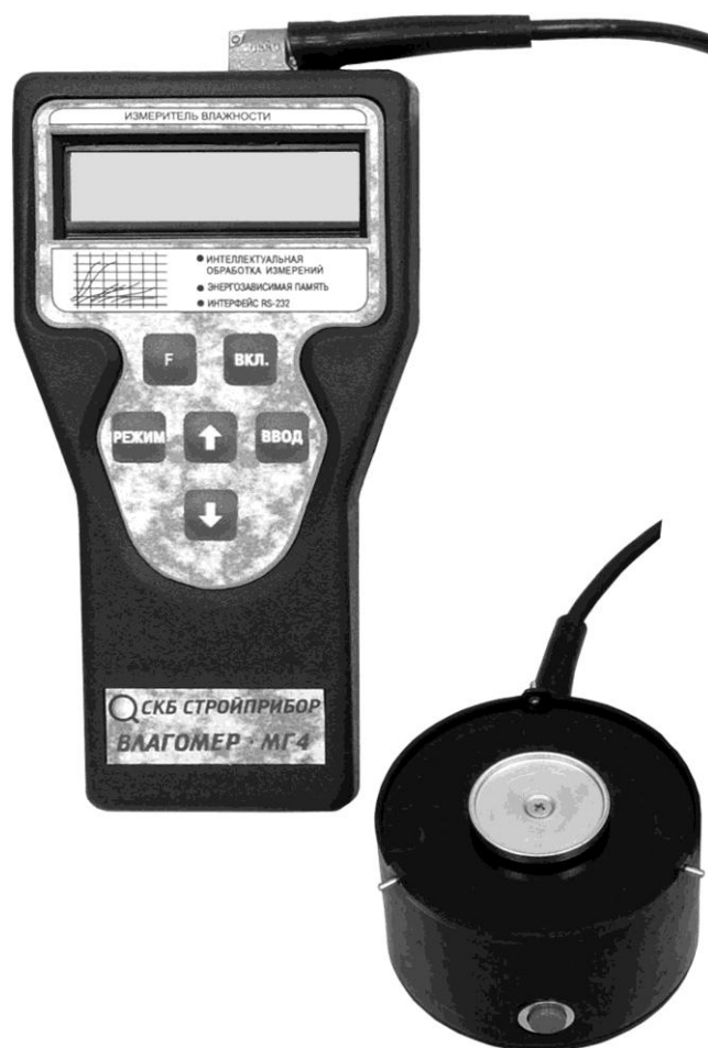
Рисунок 1 - Общий вид Влагомера-МГ4-Б

1.3.2 Влагомеры поставляются заказчику в потребительской таре.