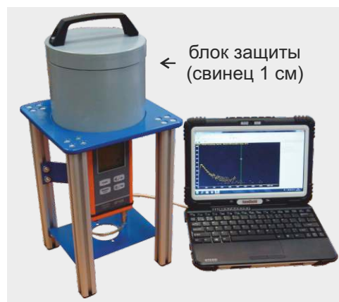
← блок защиты (свинец 1 см)

В приборе реализована возможность проведения радиометрического контроля проб на содержание радионуклидов с использованием свинцовой защиты в условиях помещения и экспресс-контроля в полевых условиях без нее.