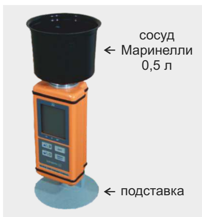
← сосуд Маринелли 0,5 л