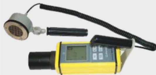
Подключение внешнего блока детектирования БДПС-02