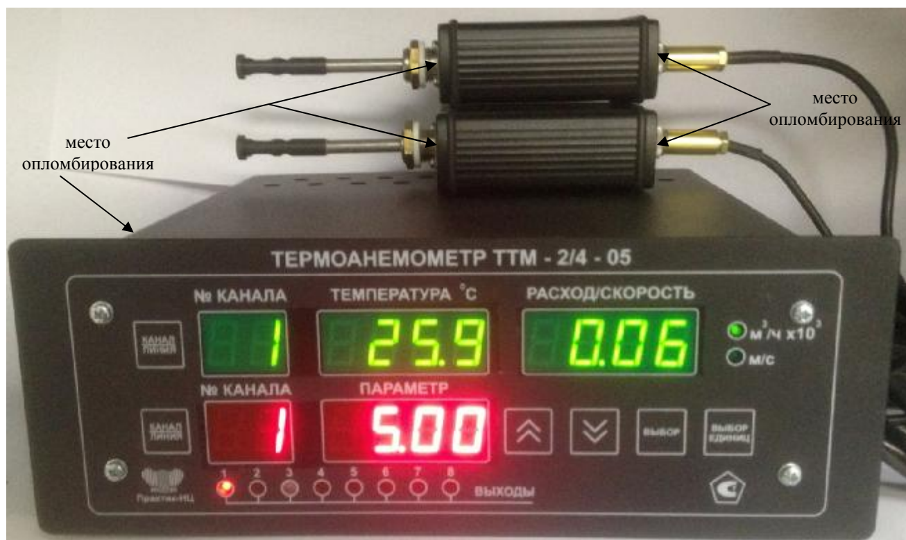
Рисунок 7. Модификация ТТМ-2/4-05