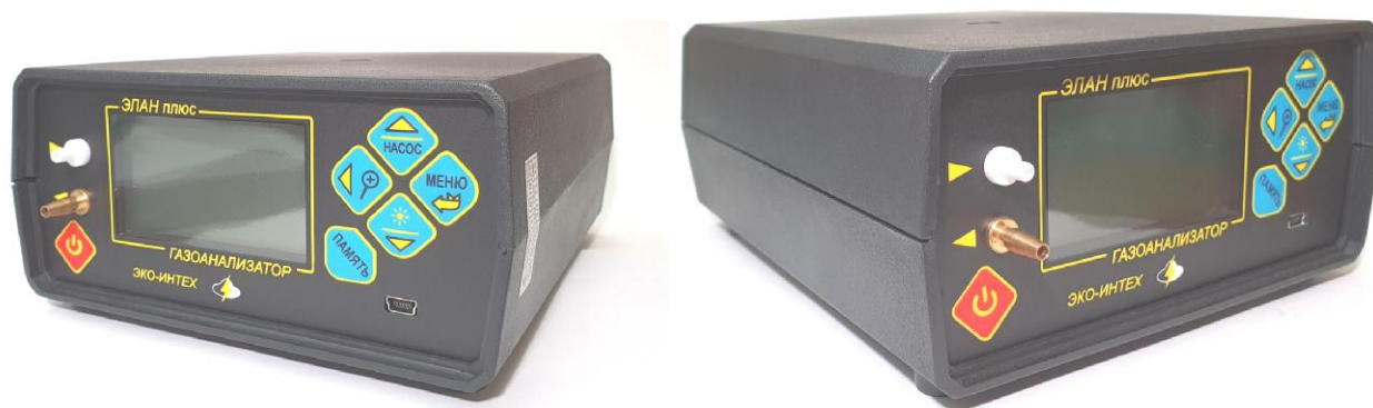
Рисунок 1 – Общий вид газоанализаторов «ЭЛАН плюс»

Общий вид газоанализаторов приведен на рисунке 1.