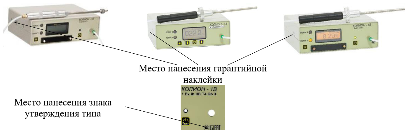
Рисунок 1 – Общий вид переносных моделей газоанализаторов КОЛИОН-1