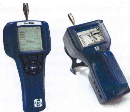
Рис. 1 – Внешний вид счётчиков AeroTrak Handheld