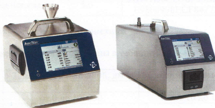
Рис. 2 – Внешний вид счётчиков AeroTrak Portable