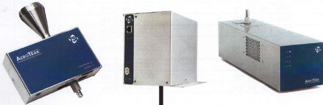
Рис. 3 – Внешний вид счётчиков AeroTrak Remote