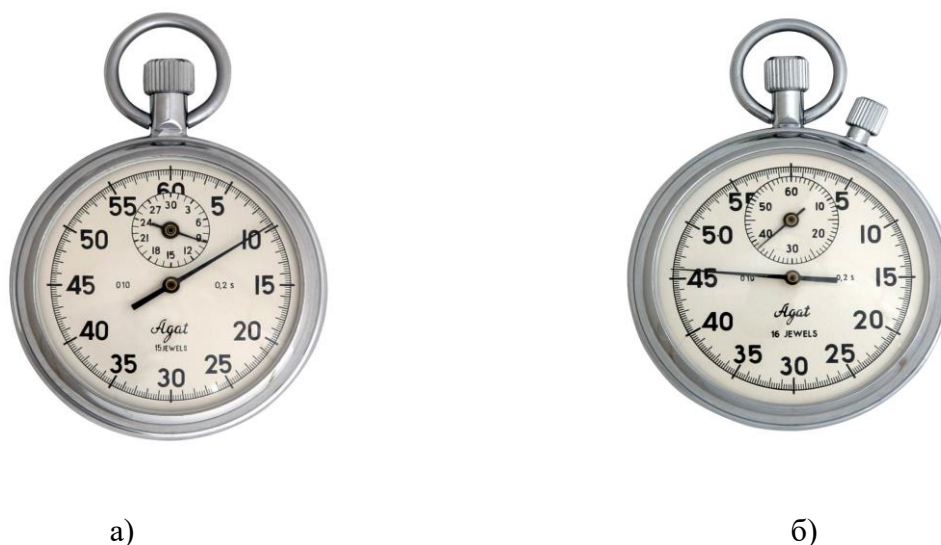
Рисунок 1 – Общий вид секундомеров механических однострелочных СО а) исполнение СОПр; б) исполнение СОСпр