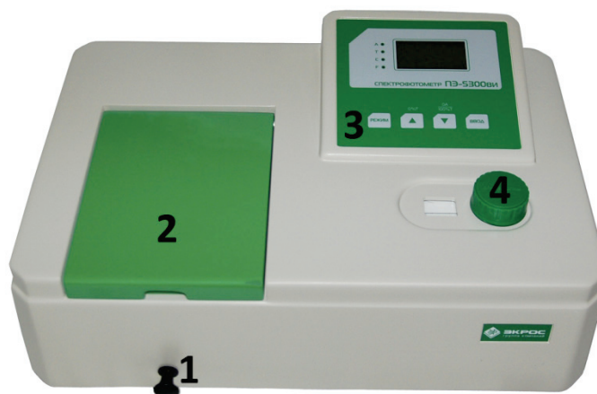
Рисунок 3 - Спектрофотометр ПЭ-5300ВИ.

Обозначения: 1 - ручка перемещения кювет; 2 - крышка кюветного отделения; 3 - панель управления; 4 - ручка установки длины волны.