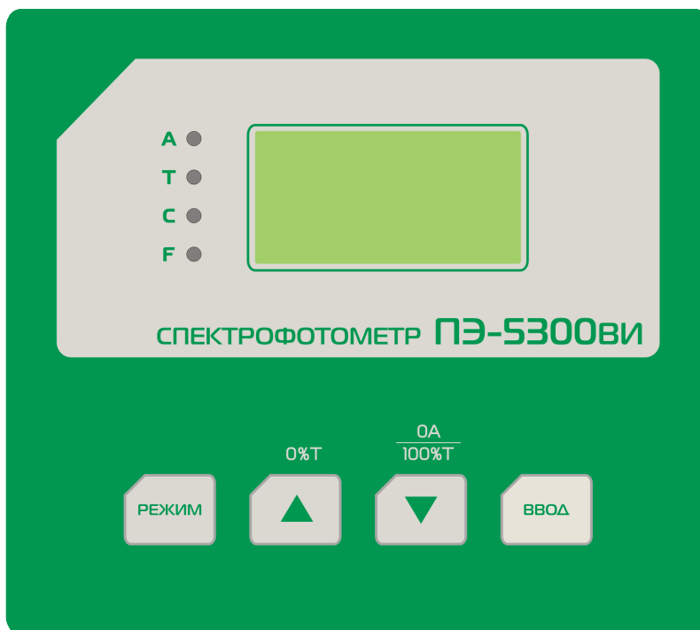
Рисунок 2 - Панель управления спектрофотометра ПЭ-5300ВИ.

Кнопка РЕЖИМ : производит переключение режимов.