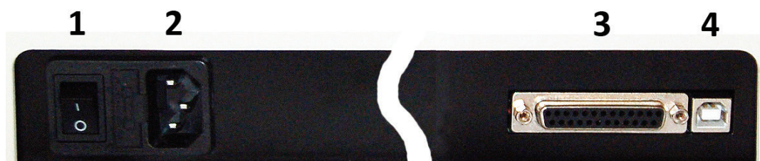
Рисунок 6 - Задняя панель прибора.

Kin5300 – программа кинетического анализа. Измерение образца на одной заданной длине волны, с заданным периодом в течение заданного промежутка времени. Может быть установлена задержка начала измерения на определенное время. При задании параметров измерения, могут быть введены коэффициенты для пересчета оптической плотности в концентрацию.