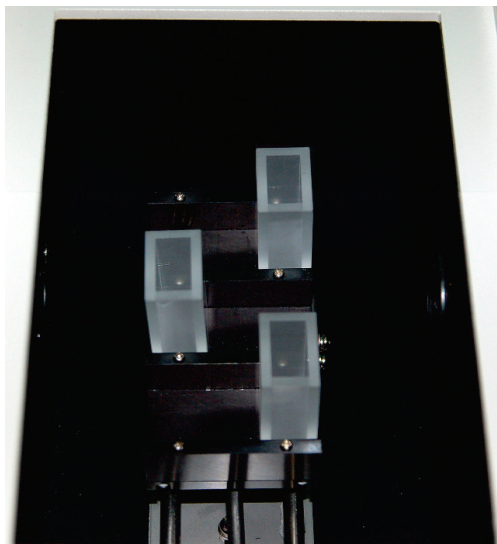
Рисунок 5 - Установка кювет в шахматном порядке.