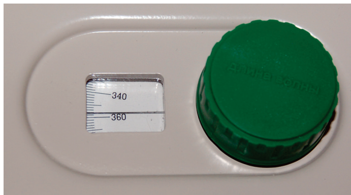
Рисунок 4 - Узел установки длины волны.

ющихся на индикаторе. В режиме F прибор запоминает значение фактора и переводит прибор в режим расчета концентрации C , значение которой будет рассчитано по формуле Cx = Ax * F .