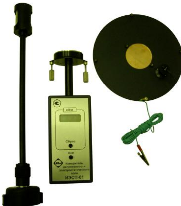
Рисунок 1. Фотография общего вида измерителей.