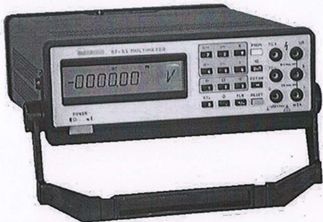
Рисунок 1 – Общий вид вольтметров