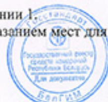
Схема пломбирования генераторов от несанкционированного доступа с указанием мест для нанесения оттиска знака поверки приведена в приложении 2.

Место нанесения знака поверки в виде клейма-наклейки указано в приложении 1.