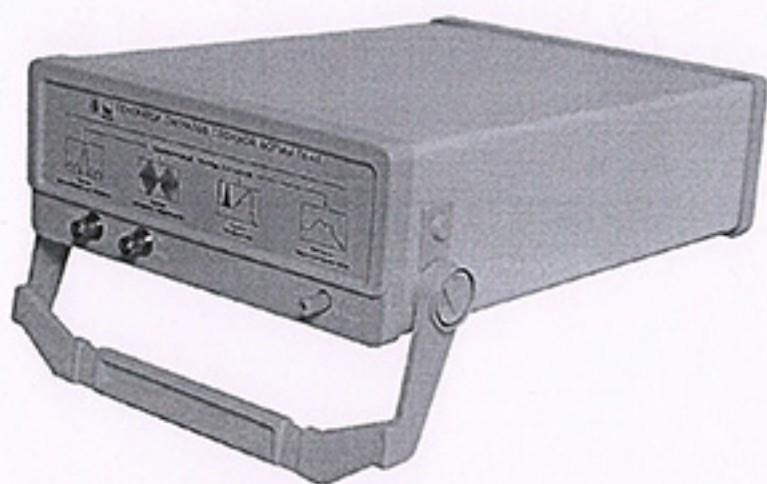
Генератор сигналов сложной формы Г6-45