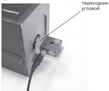
Рисунок 5. Использование переходника углового.

ется с помощью переходника углового из комплекта поставки. Рисунок 5.