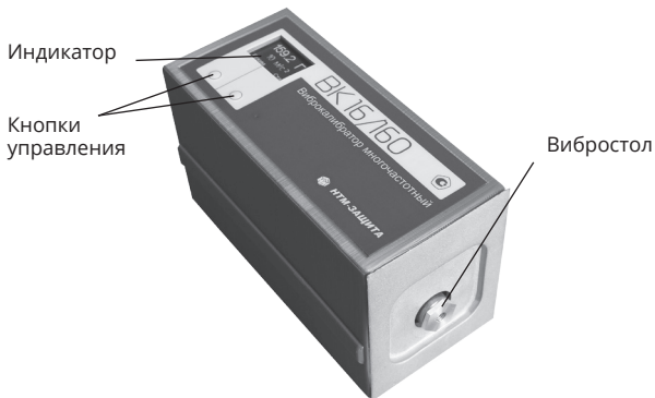
Рисунок 1. Виброкалибратор многочастотный «ВК 16/160»

1.4.4.1 Включение калибратора осуществляется длительным, от 3-х до 5-ти секунд, нажатием левой кнопки (калибратор обращен к оператору длинной стороной корпуса, вибростол калибратора ориентирован в правую от оператора сторону). Рисунок 2.