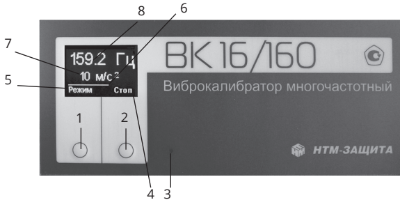
Рисунок 2. Назначение кнопок управления и содержание экрана индикатора.

1 – кнопка включения/выключения и переключения режимов; 2 – кнопка запуска и остановки воспроизведения колебаний; 3 – контрольный светодиод зарядки аккумуляторов; 4,5 – текущее назначение кнопок; 6 – индикатор времени воспроизведения колебаний; 7 – СКЗ ускорения установленного режима; 8 – частота колебаний установленного режима.