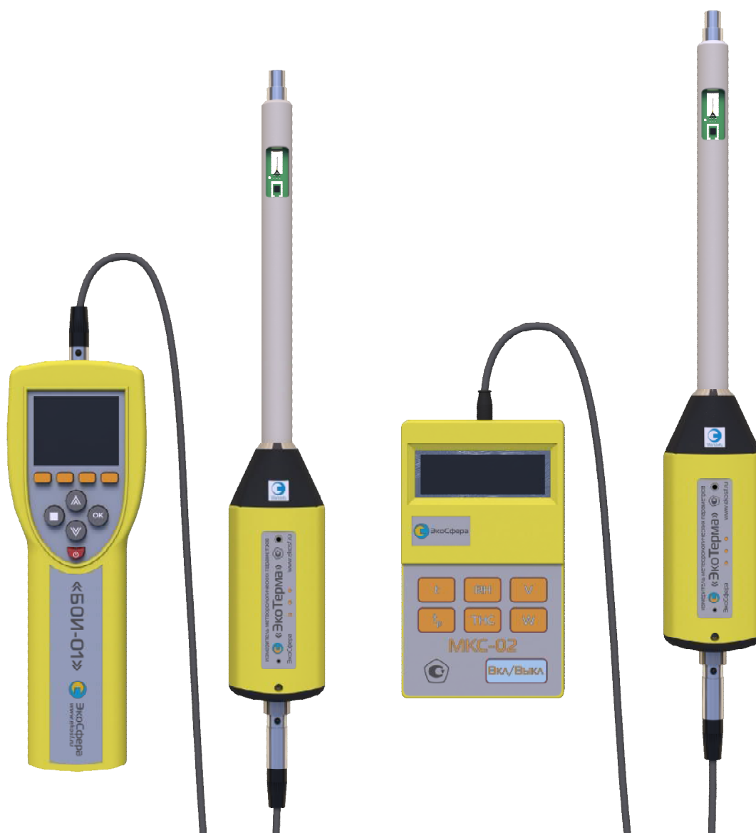
Рисунок 1. Внешний вид станций «ЭкоТерма» (исполнение «ЭкоТерма-01» - слева, исполнение «ЭкоТерма-02» - справа).

Исполнения станций «ЭкоТерма» не отличаются по набору измеряемых параметров, при этом в исполнении «ЭкоТерма-01», помимо параметров для которых необходим «черный шар», блоком индикации отображаются температура точки росы и температура влажного шарика термометра.