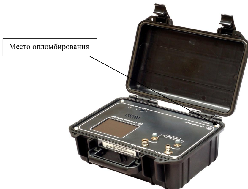
Рисунок 1 - Общий вид гигрометра ИВА-10М

Общий вид гигрометра и схема пломбировки от несанкционированного доступа представлены на рисунке 1.