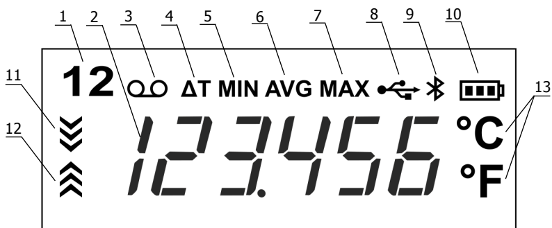
Рисунок 2 — Дисплей термометра

1.4.3 На рисунке 2 показан дисплей термометра.