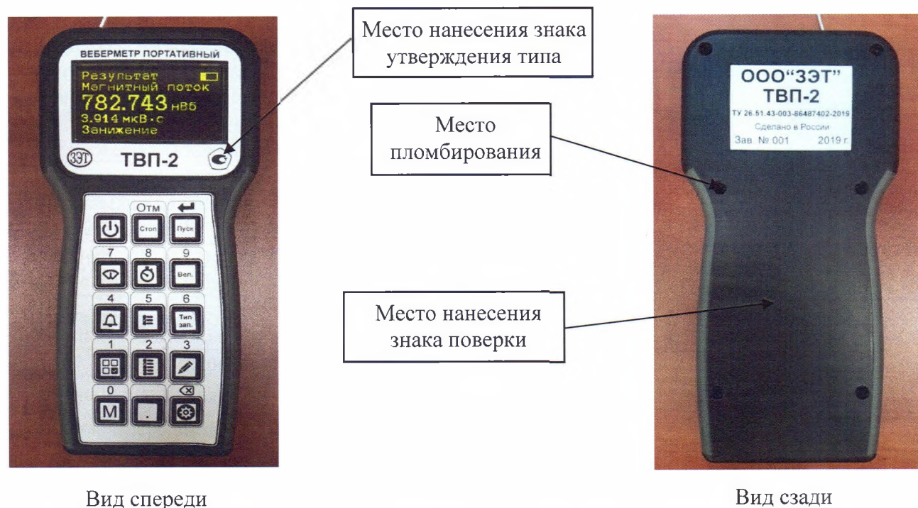
Рисунок 1 – Общий вид средства измерений, схема пломбировки от несанкционированного доступа, обозначение места нанесения знака поверки