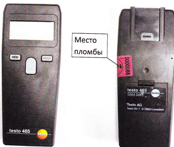
Рисунок 2. Фототахометр электронный Testo-465