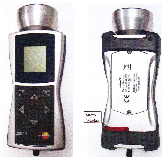
Рисунок 5. Строботажометр электронный Testo-477