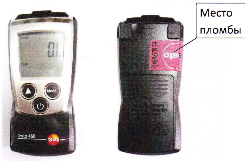
Рисунок 1. Фототахометр электронный Testo-460

Внешний вид тахометров электронных Testo и схема пломбировки приведены на рисунках: