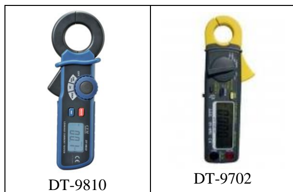
Рисунок 1. Фотографии общего вида клещей серии DT