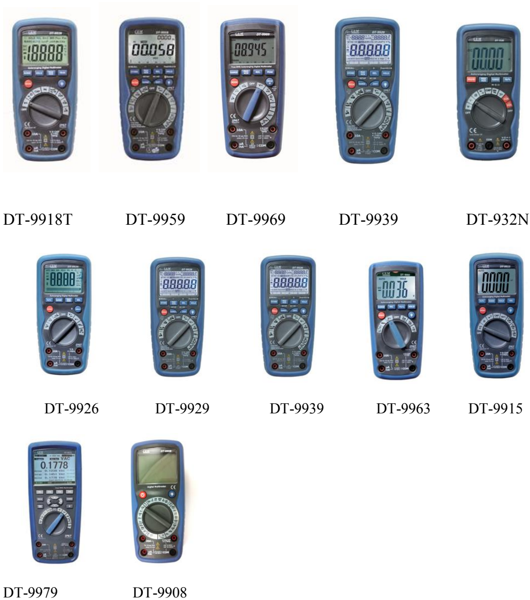
Рисунок 1. Фотографии общего вида мультиметров цифровых серии DT