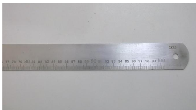
а) линейка с одной шкалой

Внешний вид линейки представлен на рисунке 1.