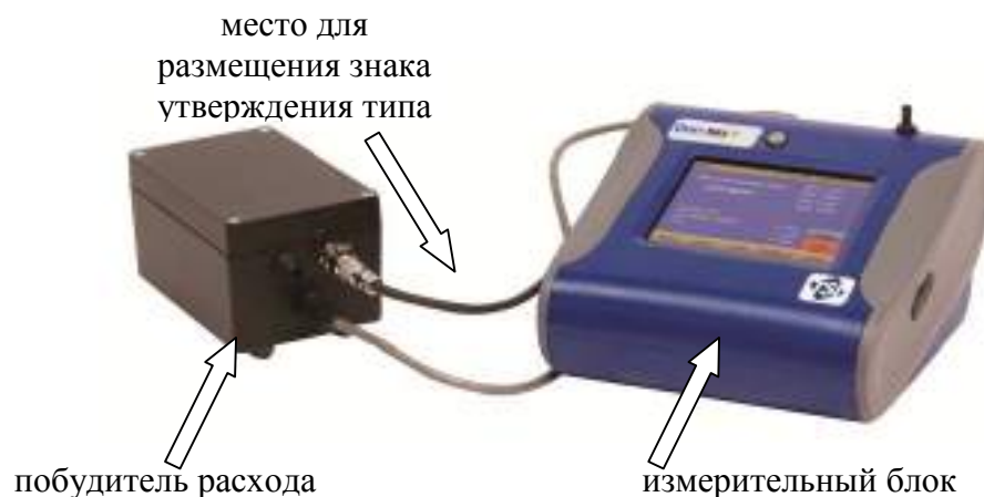
Рисунок 1 – Внешний вид анализаторов DUSTTRAK 8530, DUSTTRAK 8533, выполненных в блочном виде, обозначение места для размещения знака утверждения типа

Внешний вид анализаторов и обозначение места для размещения знака утверждения типа представлены на рисунках 1 и 2. Схема пломбировки анализаторов представлена на рисунке 3.