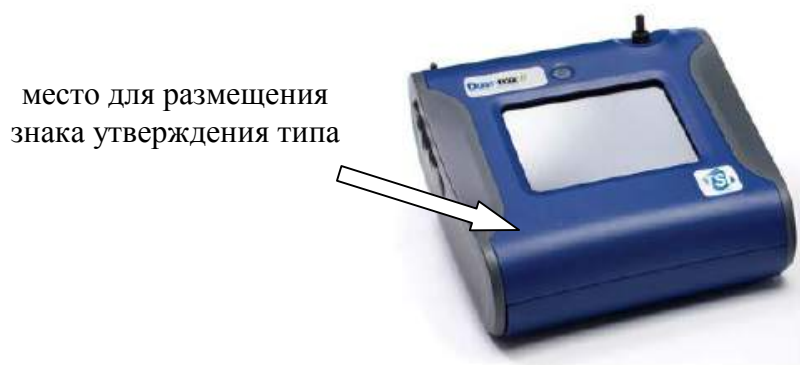
Рисунок 2 – Внешний вид анализаторов DUSTTRAK 8530, DUSTTRAK 8533, выполненных в виде моноблока, обозначение места для размещения знака утверждения типа