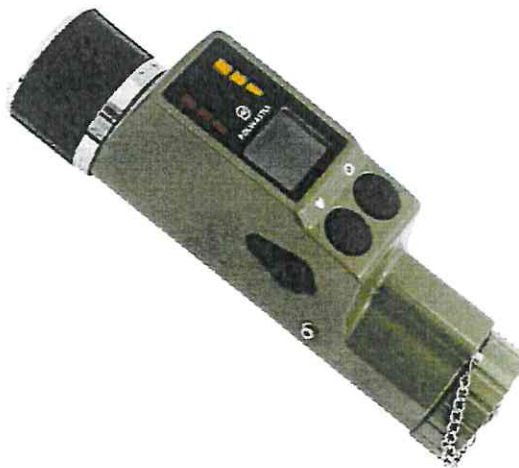
Рисунок 1 – Общий вид дозиметров

Общий вид дозиметра представлен на рисунке 1.