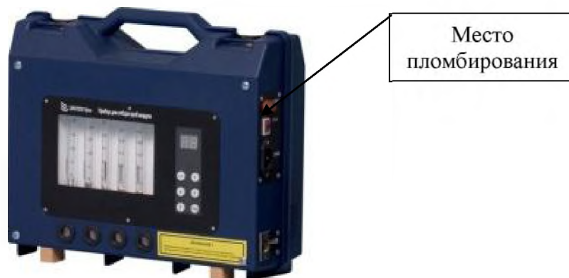
а) приборы в пластиковом корпусе