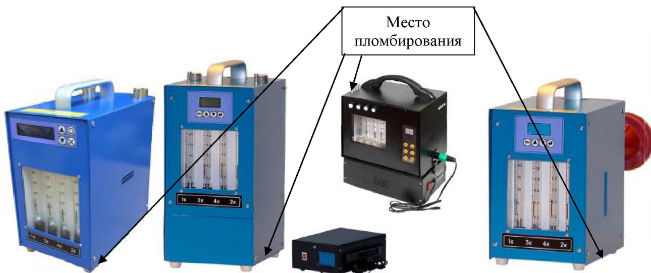
б) приборы в металлическом корпусе