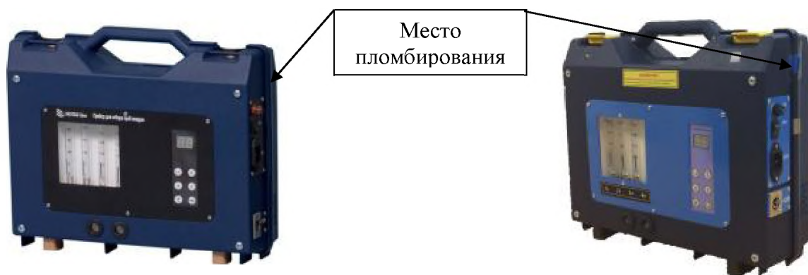
а) приборы в пластиковом корпусе