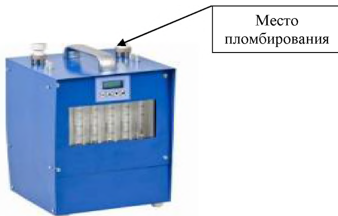
Рисунок 4 – Общий вид приборов ПА-40М-3-1