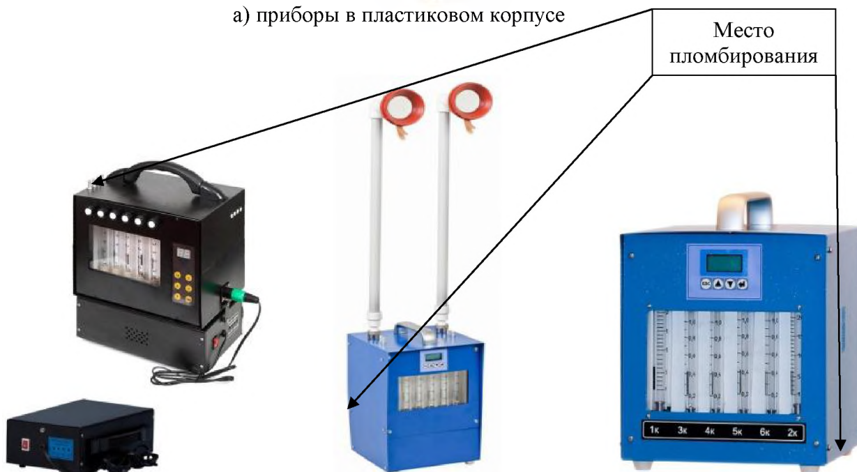
б) приборы в металлическом корпусе Рисунок 3 – Общий вид приборов ПА-40М-3