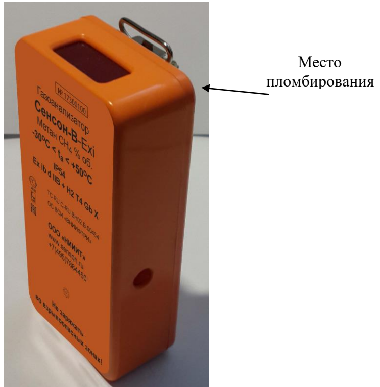
Рисунок 1 - Общий вид модели В (индивидуального).