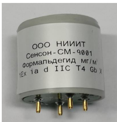
Рисунок 7 - Общий вид модели СМ (интеллектуальный сенсорный модуль).

Пломбирование модели СМ не предусмотрено.