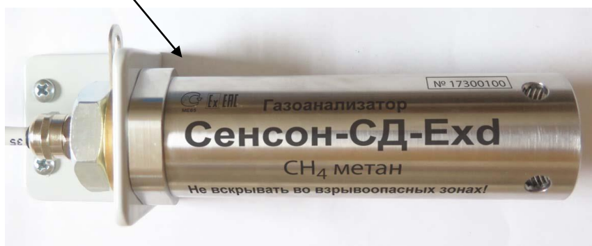
Рисунок 6 - Общий вид модели СД (в металлическом взрывозащищенном корпусе Exd).