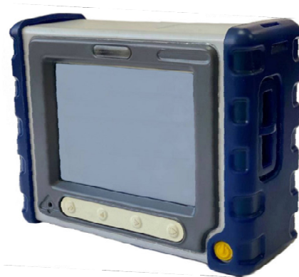
Рисунок 1 – Общий вид газоанализаторов универсальных Эколаб плюс

Общий вид газоанализаторов представлен на рисунке 1. Схема пломбировки от несанкционированного доступа представлены на рисунке 3.