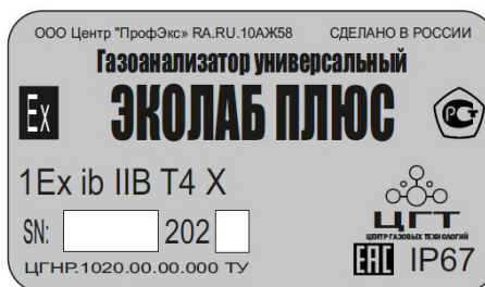
Рисунок 2 – Идентификационная табличка газоанализаторов