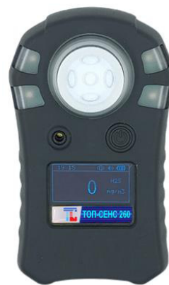
б) модификация ТОП-СЕНС 260