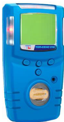
а) модификация ТОП-СЕНС 210

Общий вид газоанализаторов представлен на рисунке 1.