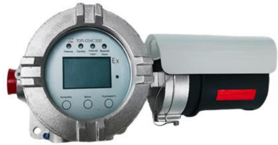
з) модификация ТОП-СЕНС 500