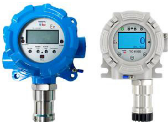
л) модификация ТОП-СЕНС 4100 G