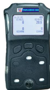
г) модификация ТОП-СЕНС 360