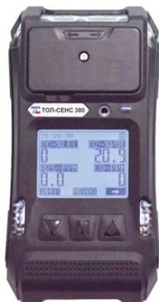
д) модификация ТОП-СЕНС 380