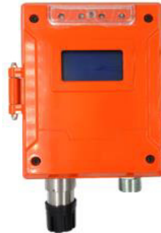
к) модификация ТОП-СЕНС F