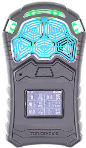
ж) модификация ТОП-СЕНС 610