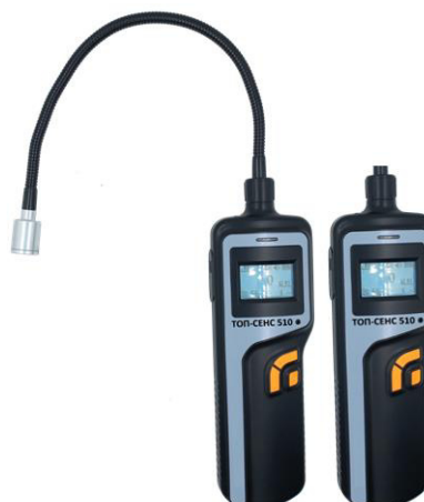
е) модификация ТОП-СЕНС 510