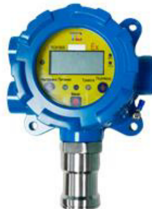
м) модификации ТОП-СЕНС 4100 S