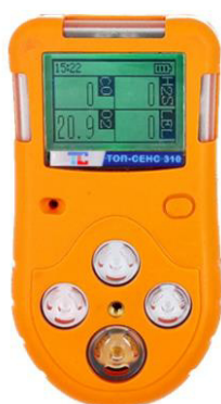
в) модификация ТОП-СЕНС 310