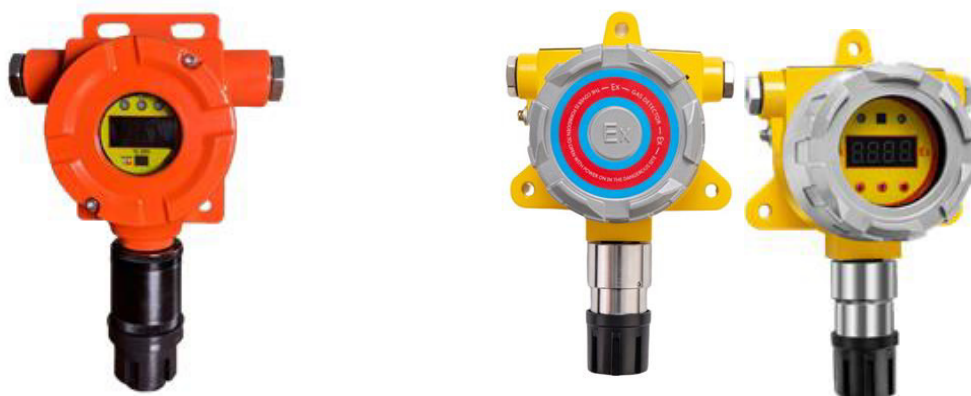
н) модификация ТОП-СЕНС 10 N