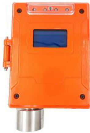
и) модификация ТОП-СЕНС 1000