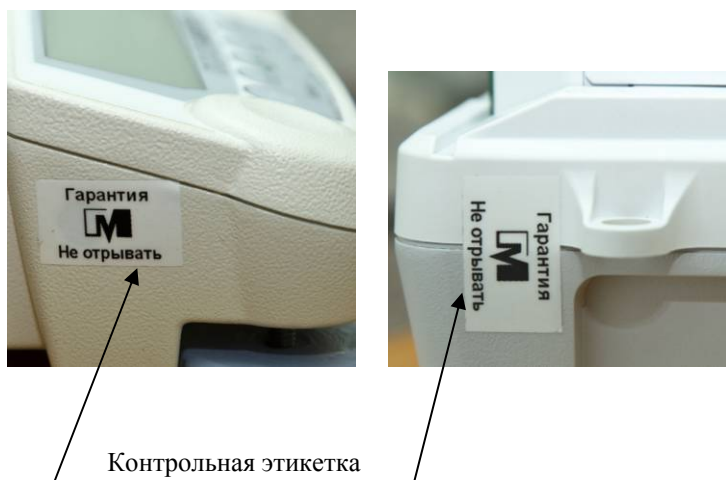
Рисунок 2 - Схема пломбирования от несанкционированного доступа

Для защиты весов от несанкционированной настройки и вмешательства, которые могут привести к искажению результатов измерений, весы пломбируются контрольными этикетками изготовителя. Схема пломбирования и обозначение места нанесения знака поверки представлены на рисунках 2 и 3, соответственно.